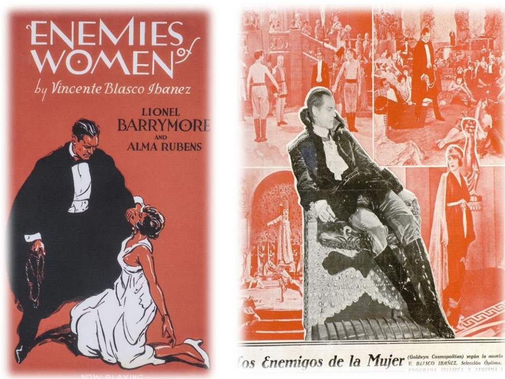
Imágenes publicitarias de las versiones estadounidense y española de la película

fechado el 20 de enero de 1921, para realizar la adaptación fílmica del libro. Una producción que requirió de un gran aporte monetario y para la que el equipo de rodaje liderado por el director Alan Crosland y los actores Lionel Barrymore y Alma Rubens se trasladó a la Costa Azul, donde el propio Blasco Ibáñez actuaría como guía y anfitrión, en noviembre de 1922.